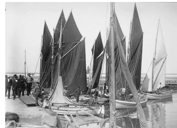
Her i Sandvig Havn.