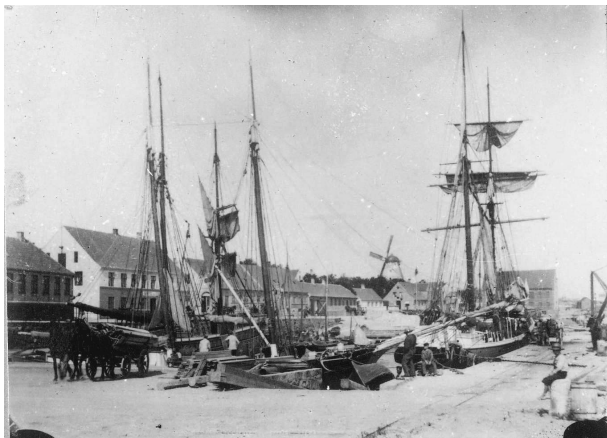
Den gang var der sejlskibe! Her i Allinge Havn.

Efter englandskrigene mistede Danmark Norge, og den danske stat gik bankerot. Der ventede strenge tider for den danske befolkning, og fattigdommen prægede også Allinge. Mange af kaperne havde levet godt under englandskrigen, men pengene var også hurtigt blevet brugt for manges vedkommende. Flere havde dog gemt pengene af vejen og investeret klogt, og de brugte sidenhen pengene til at starte nye virksomheder op.