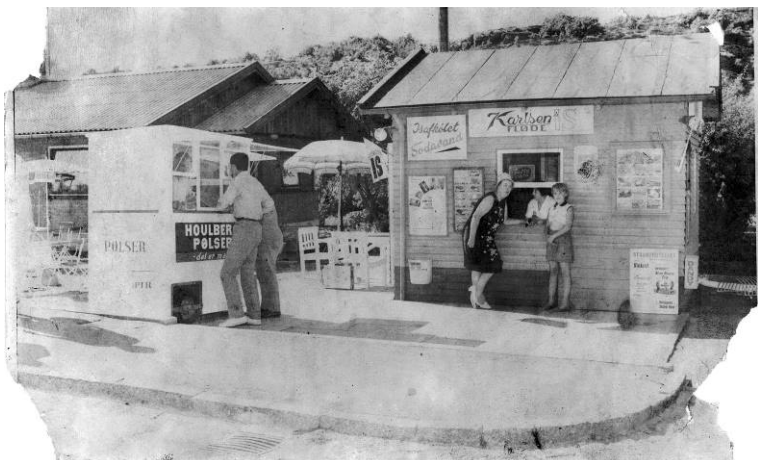
Fortid på et glemt hjørne i Sandvig. (nedkørslen til plejehjemmet). Janes Kiosk, Hammershusvej, Sandvig. "Bliver 65 år ..."