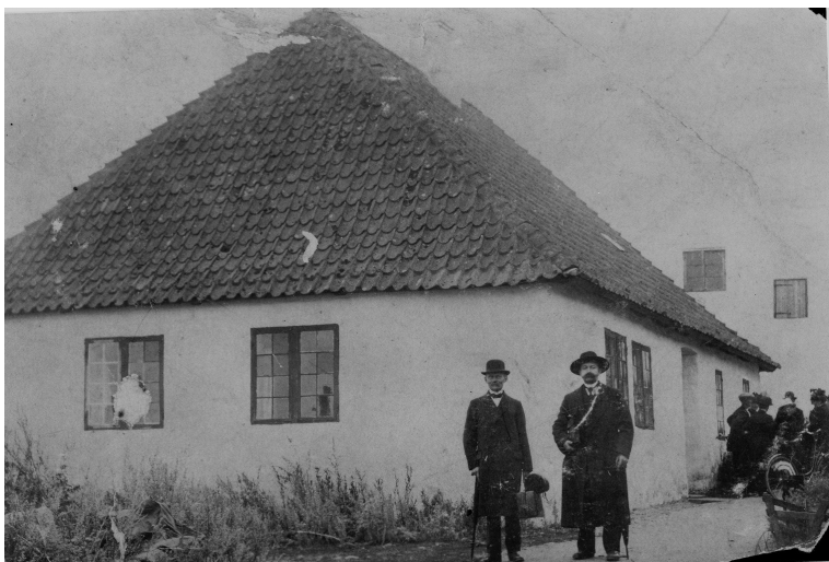
Tinghuset. Der er desværre ikke flere oplysninger.