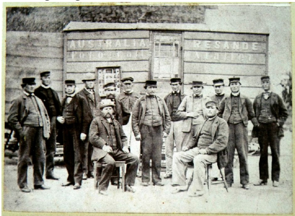
"N.E. Plymouth. Australia-Fotografi-Vagn". Borrby 1869.