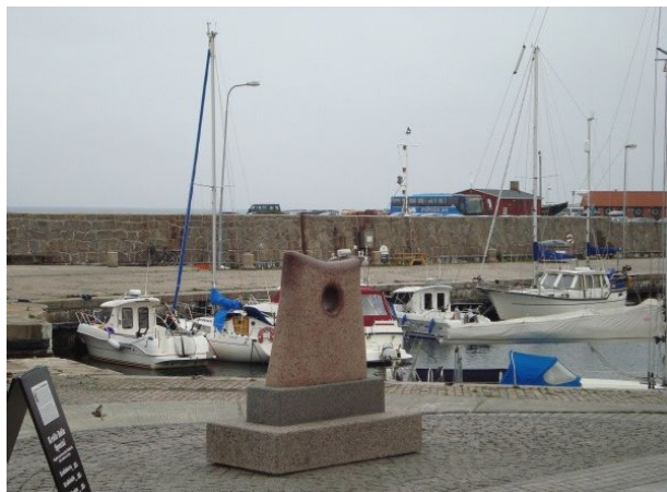
”Ivnasten” (Øjesten). på Allinge Havn.

Indsamlinger af penge har foreløbig givet følgende resultat: