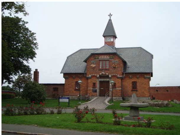
”Gennembrud” ved Allinge Bibliotek.