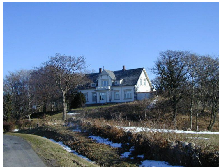
Pension Nøddebo kort før nedrivningen.