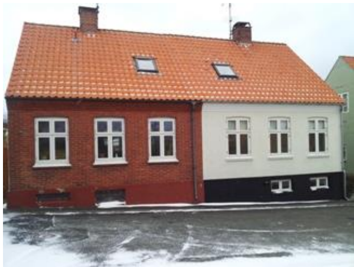
Brogade 14 (huset til venstre) den 29/1-2014.