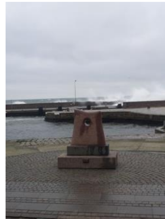
Ivenstenen en stormfuld januar dag 2014.

Så er det endelig lykkedes for foreningen at skaffe tilstrækkelig mange penge til køb af kunstværket – Ivenstenen – på Allinge Havn. Det er kun lykkedes takket være støtte fra Sparekassen Bornholms Fond, Nordeafonden og ikke mindst ved en stor anonym gave. Kunstværket vil blive overrakt ved en lille festlighed søndag den 4. maj kl. 15 – naturligvis på havnen.