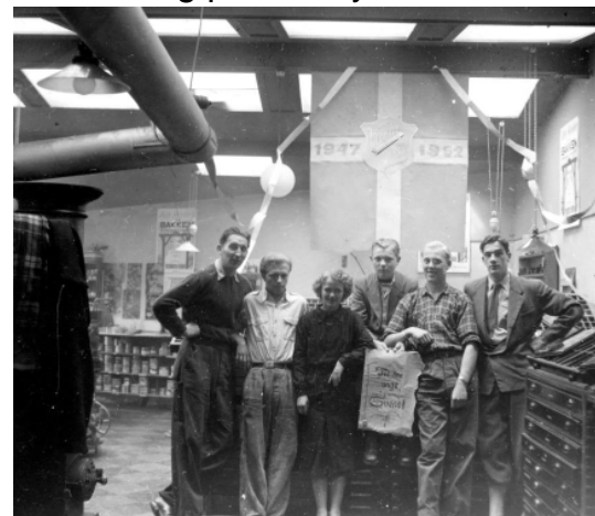
Svendegilde i trykkeriet i Storegade 1952