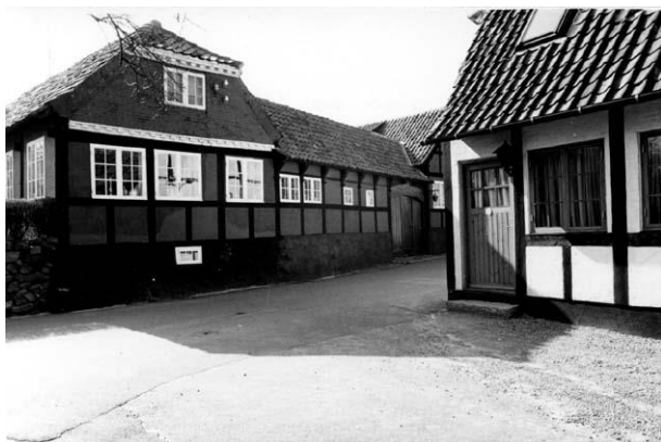
Løsebækgade 20 Næsgården.