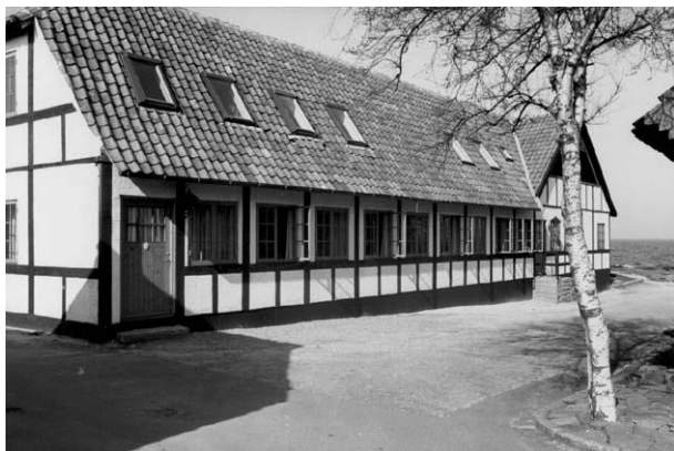
Byskrivergården Løsebækgade 3. Foto 1975. Robert Egevang.

Gården er en af Allinges 4 byskrivergårde. Er i 1970 indrettet til "Pension Byskrivergården".