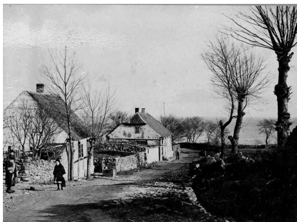
Fuglesangen 11, 13 og 15.