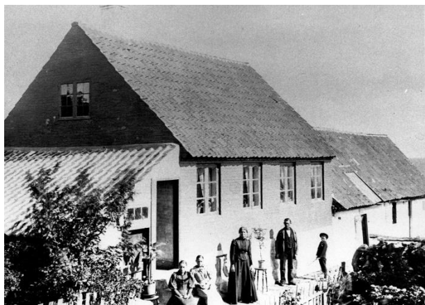
Billedet viser Fuglesangen 7.