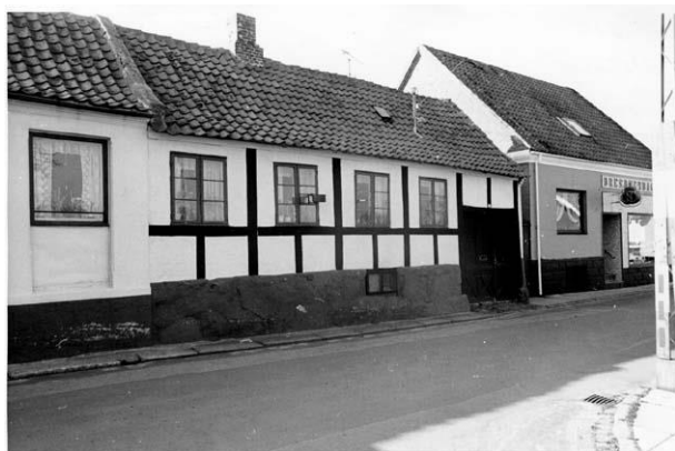
Den gamle bygning i nr. 10 er revet ned, og der er nu bagerforretning.

I 1810 udstykkes fra nr. 10 nr. 12 a og i 1876 nr. 12 b. Nr. 12 kaldes også Hjulmagergården. Her var o. 1900 karetmagerværksted.