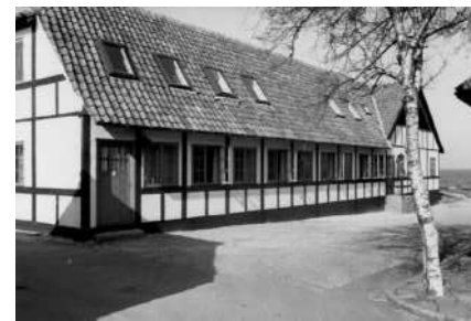
Byskrivergården Løsebækgade 3. Foto 1975. Robert Egevang.

Gården er en af Allinges 4 byskrivergårde. Er i 1970 indrettet til "Pension Byskrivergården".