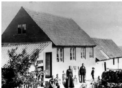
Billedet viser Fuglesangen 7.