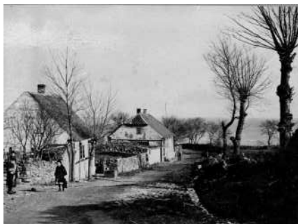
Fuglesangen 11, 13 og 15.