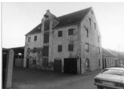
Købmand Kurts pakhus i Søndergade.

De efterfølgende huse der ses på billedet er Søndergade 1 og 3, som begge stammer fra ca. 1770. Nr. 1 er senere ombygget med skalmur. Nr.3 har bevaret bindingsværket.