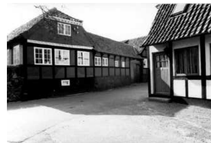
Løsebækgade 20 Næsgården.