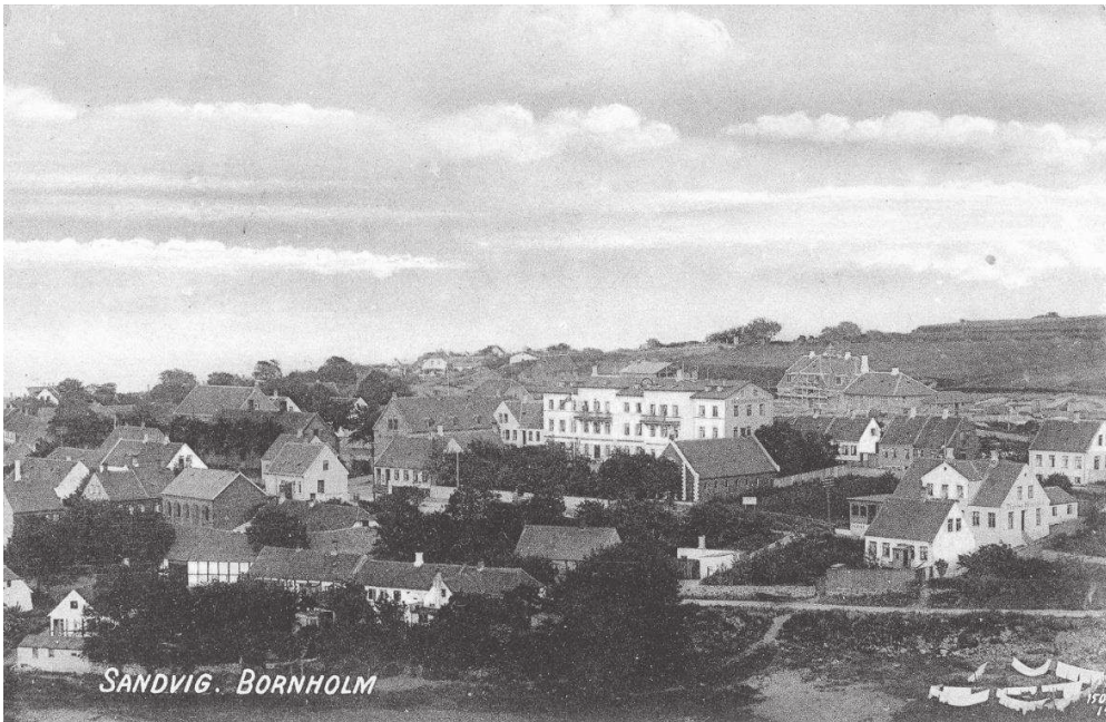
En hilsen fra Allinge-Sandvig Byforening